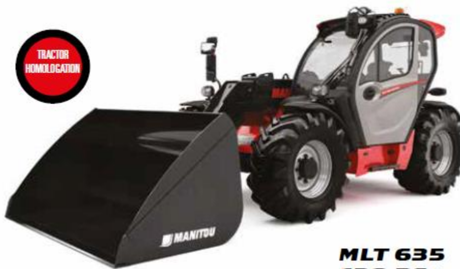
MLT 635 130 PS+